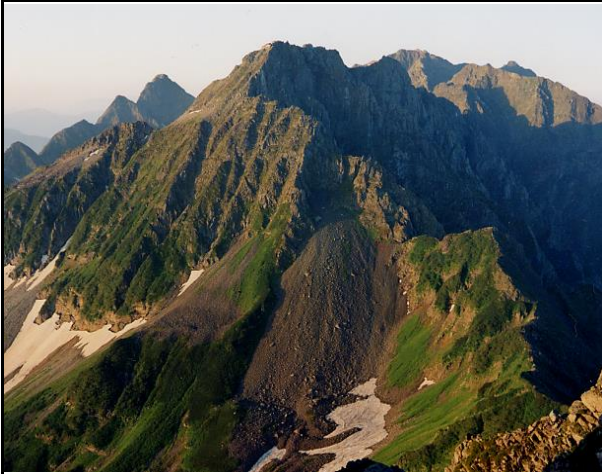
南岳から大キレット北穂、奥穂岳